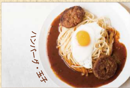
ミートボール 300g ¥1,000