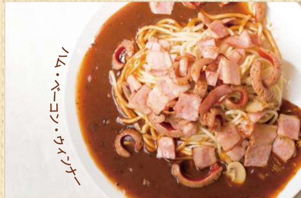
ミラネーズ 300g ¥1,000