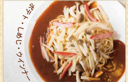
ポテトスパ 300g ¥900