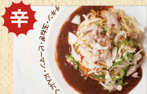
チキンガーリック 300g ¥950