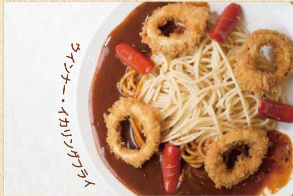
イカリングスパ 300g ¥950