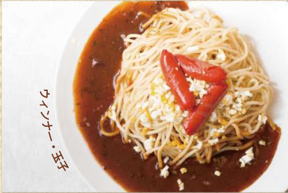
イタリアン 300g ¥750