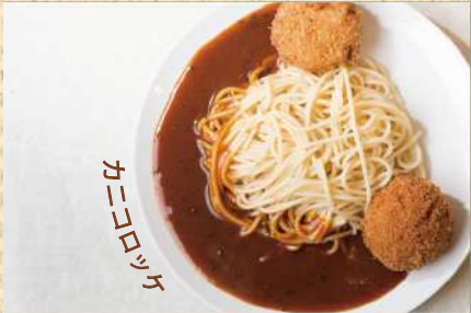
カニコロスパ 300g ¥1,000