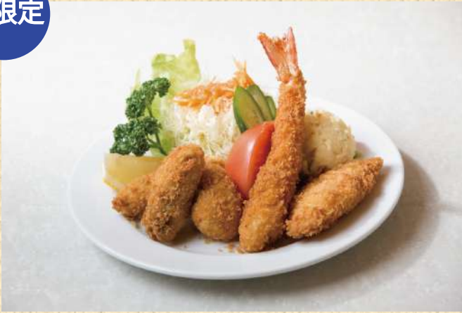
ミックスフライ (カキ有り) ¥1,100