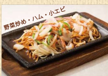
野菜ソテースパ 300g ¥950