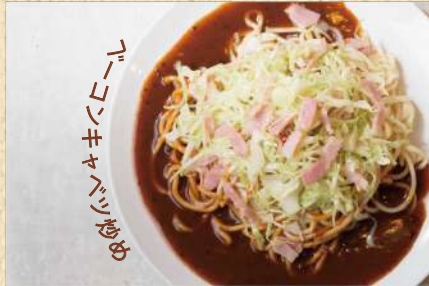
ベーコンソテー 300g ¥850