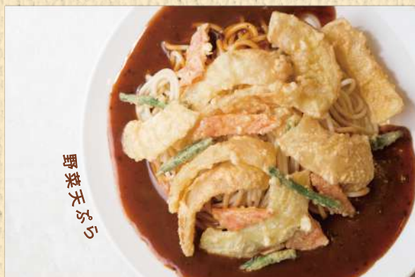
ベジタブル 300g ¥850