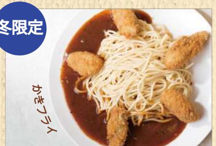
かきスパ 300g ¥1,000