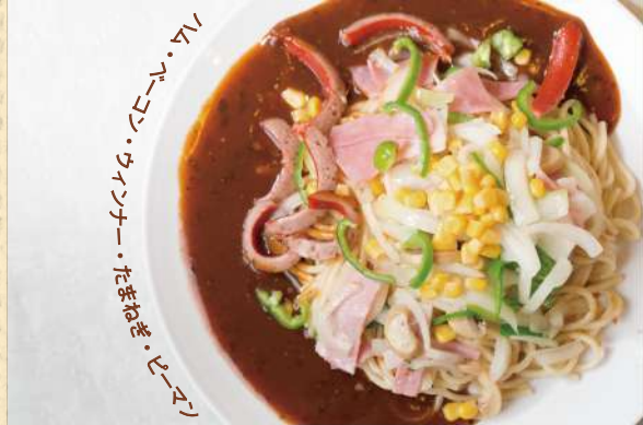
ミラカン 300g ¥950