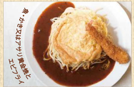
バイキング 300g ¥1,350