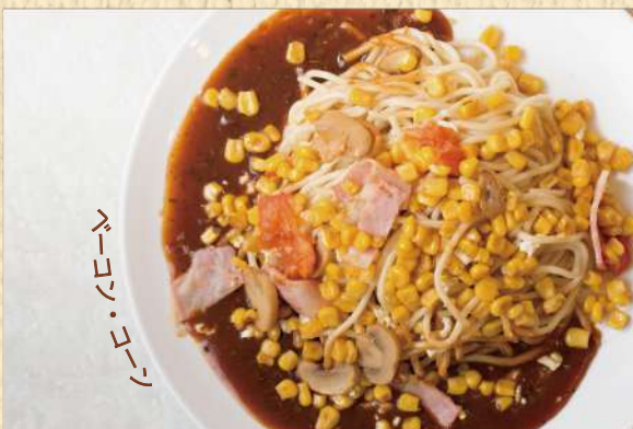
メキシカン 300g ¥900